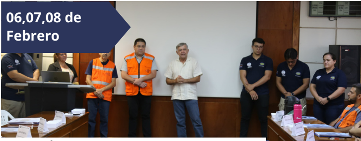
CURSO BÁSICO DE SISTEMA DE COMANDO DE INCIDENTES