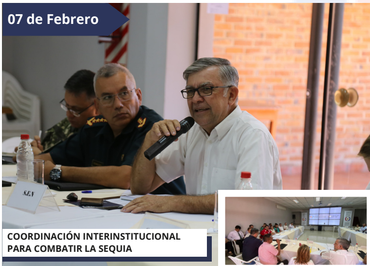
COORDINACIÓN INTERINSTITUCIONAL PARA COMBATIR LA SEQUIA

El ministro de la SEN, Arsenio Zárate, lidera la mesa técnica de agua y saneamiento conformada por diferentes instituciones. Se trabajará coordinadamente para el traslado y distribución de agua, a fin de asistir a familias del Chaco afectadas por la sequía.