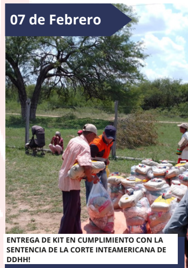
ENTREGA DE KIT EN CUMPLIMIENTO CON LA SENTENCIA DE LA CORTE INTEAMERICANA DE DDHH!