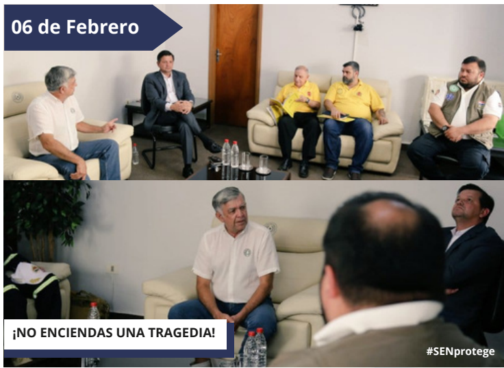
¡NO ENCIENDAS UNA TRAGEDIA!