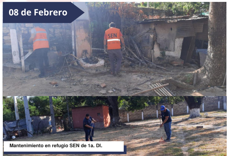
Mantenimiento en refugio SEN de 1a. DI.

Hicimos un mantenimiento general, limpiamos y sacamos basura de nuestro refugio instalado en la Primera División de Infantería. Periódicamente destinamos personal y recursos para esta tarea, y apelamos constantemente a la conciencia ciudadana en cuanto al cuidado del medioambiente.