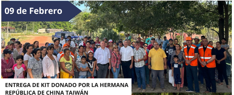
ENTREGA DE KIT DONADO POR LA HERMANA REPÚBLICA DE CHINA TAIWÁN