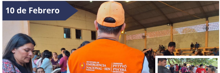
1.300 FAMILIAS DE SAN COSME Y DAMIÁN SON BENEFICIADAS CON CASI 30.000 KG DE ALIMENTOS.