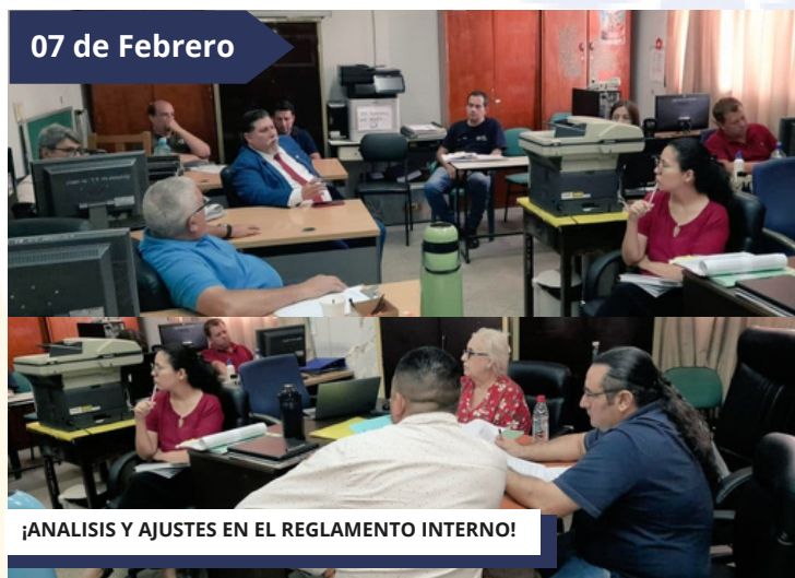
¡ANALISIS Y AJUSTES EN EL REGLAMENTO INTERNO!

El equipo técnico del MECIP*, de la SEN, se reunió para analizar y realizar ajustes en el reglamento interno institucional en base a las leyes y decretos vigentes. El MECIP comprende los planes, métodos, políticas y procedimientos utilizados para cumplir con la Misión, el Plan Estratégico y los Objetivos de la entidad.