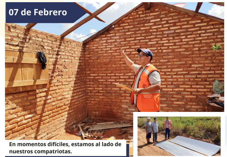
En momentos difíciles, estamos al lado de nuestros compatriotas.

Familias de Tacuatí, San Pedro, que sufrieron los embates de los fenómenos climáticos, recibieron insumos de construcción de primera necesidad, por parte de la SEN, para reparar sus casas.